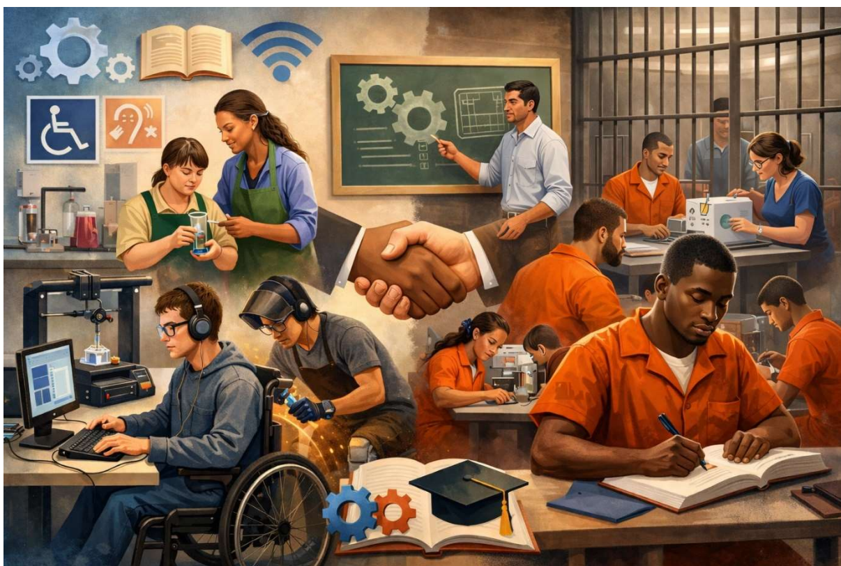
Figura 2 – Educação Profissional e Tecnológica como instrumento de inclusão social

Como ilustrado na Figura 2, a Educação Profissional e Tecnológica (EPT) contribui significativamente para a inclusão de públicos historicamente marginalizados, sem expectativa de um futuro acolhedor.