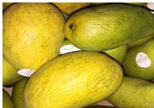
Figura 15: Desidratação

Mancha na parte externa da fruta provocada pelo excesso de látex expelido durante o período de colheita, podendo ser intensificada pelo frio ou pela a agua quente.