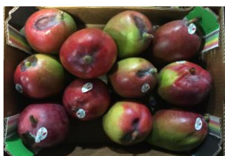
Figura 11: Mocamento

É um tipo de doença causada por fungos e um deles é o da Antracnose, que ficam latentes e aparecem quando o fruto está em processo de amadurecimento. Caracterizada pelo apodrecimento do fruto onde a polpa da fruta fica escura e a casca sensível e sujeita a rompimentos, além de um odor característico.