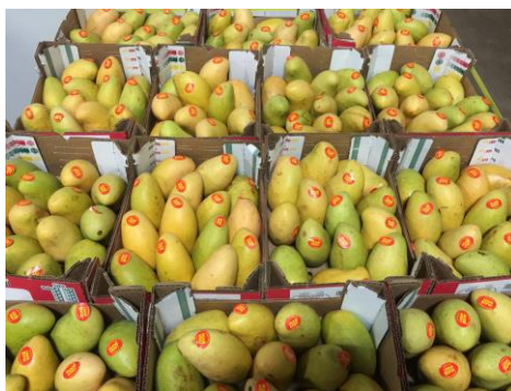
Figura 5: Manga da variedade Ataulfo.