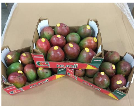
Figura 3: Manga da variedade Kent.

A variedade Kent surgiu no estado da Flórida - EUA. É uma fruta oval com casca verde amarelado, corado de vermelho púrpuro, como pode ser observado nas figuras abaixo, possui porte grande com peso de 550 a 1000 g (com média de 657 g), muito saborosa, teor de sólidos solúveis de aproximadamente 20,1°Brix e possui uma alta qualidade de polpa (quase sem fibra). Semente mono embrionária, suscetível a antracnose e ao colapso interno e possui baixa vida de prateleira. Ciclo de maturação médio a tardio. Com relação ao mercado apresenta boas perspectivas para exportação, (EMBRAPA, 2004).