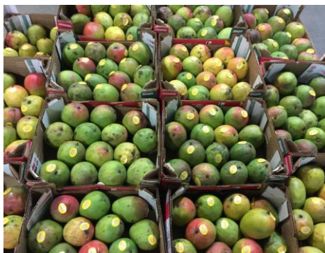
Figura 1 – Manga da variedade Haden

É originária da Flórida nos EUA, fruta com peso variando de 350 a 680 g, ovalada, possui cor amarela quase coberto com vermelho, sabor suave e pouca fibra e semente mono embrionária. Apresenta baixo vigoramento dos frutos, o que pode ser minimizado pela utilização de polinizadores. Precoce e suscetível a antracnose assim como outras variedades selecionadas na Flórida, a Haden tem grandes chances de apresentar o problema do colapso interno no fruto (EMBRAPA, 2004).