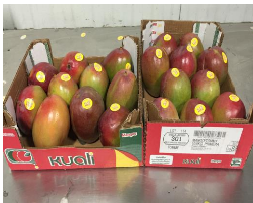
Figura 4: Manga da variedade Tommy atkins.

período de conservação. Precoce, amadurece bem se colhido imaturo. Apresenta problemas do colapso interno do fruto, mau formação floral e teor de sólidos solúveis de 16°Brix, quando comparado com as variedades Palmer e Haden. É uma das variedades de manga mais cultivadas mundialmente para exportação. Apresenta facilidade para indução floral em época quente, alta produtividade e boa vida de prateleira. Essa variedade representa 90% das exportações de manga no Brasil (EMBRAPA, 2004).