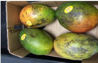
Figura 13: Queima pelo frio

É um dano causado na fruta durante o tratamento hidrotérmico que está ligada a elevação da temperatura ou o aumento demasiado do tempo em que a fruta fica em contato com a água, causando queimaduras superficiais na fruta.