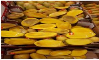
Figura 17: Descoloração interna

Consiste na mudança de cor na parte interna da fruta, apresentando-se com uma mancha escura atingindo a região próxima ao caroço e a região do pedúnculo, está relacionada com a elevação da temperatura, falta ou desequilíbrio de nutrientes, a maioria dos casos encontrados era causada por Colapso Interno.