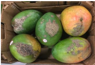
Figura 14: Queima por látex

Dano causado por baixas temperaturas. Pode ser provocado pelo hidrocooling, armazenamento ou durante a viagem, provocando manchas de queimaduras na casca fruta.