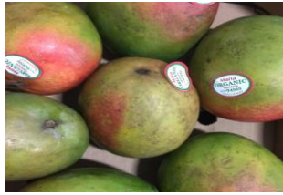
Figura 12: Queima por água quente

É um dano causado na fruta durante o tratamento hidrotérmico que está ligada a elevação da temperatura ou o aumento demasiado do tempo em que a fruta fica em contato com a água, causando queimaduras superficiais na fruta.