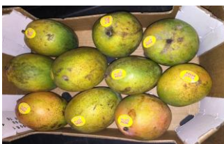
Figura 16: Danos por insetos

É perda de água durante a respiração da fruta que está ligada a muitos fatores, tratamento incorreto, excesso de etileno durante o processo de maturação , temperatura e maturidade. Sendo sua principal característica o enrugamento do fruto.