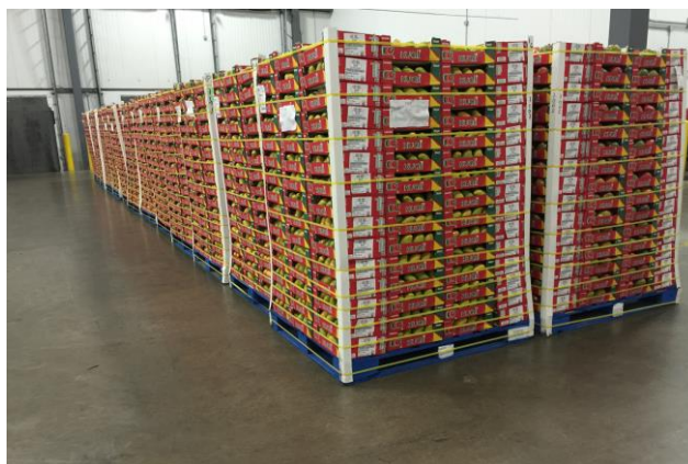
Figura 7: Pallets descarregados.

Todo o processo de descarregamento era realizado por pessoas treinadas especialmente para esse tipo de trabalho, com intuito de manter a seguridade de todos que circulam dentro da área de trabalho. O responsável pelo descarregamento tem a função de observar e identificar a quantidade de pallets que veio no embarque, pallets caídos, quantidade de caixas, temperaturas e verificação de lacre (só podiam ser rompidos pelos órgãos de fiscalização, inspetores da empresa ou pelo operador de descarregamento), esses procedimentos tinham como objetivo a certificação de que a carga chegou intacta em seu destino, constatando sua segurança alimentar e também se as informações enviadas estariam iguais com a do produtor. Os lacres eram utilizados para manter a seguridade da carga.