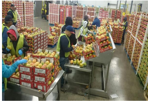
Figura 8: Reembalamento da fruta.