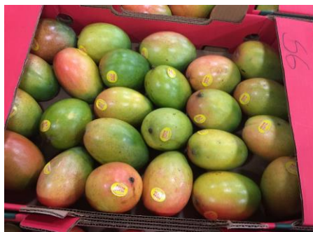
Figura 2: Manga da variedade Keitt.