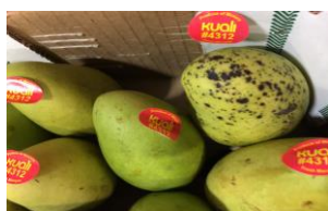
Figura 9: Antracnose

Doença caracterizada por pontos pretos com circunferência amarronzada causada por um fungo denominado Colletotrichum gloeosporioides , que afeta as folhas, flores e frutos da mangueira.