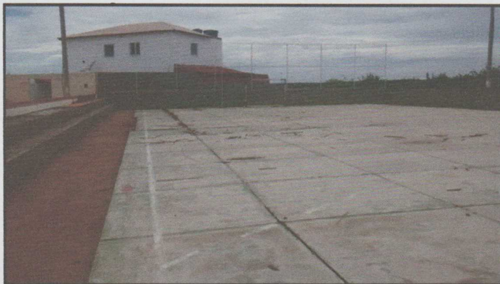
Figura 2- Detalhe do estado do piso da quadra