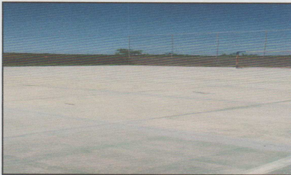
Figura 4 – Registro da reforma da quadra finalizada