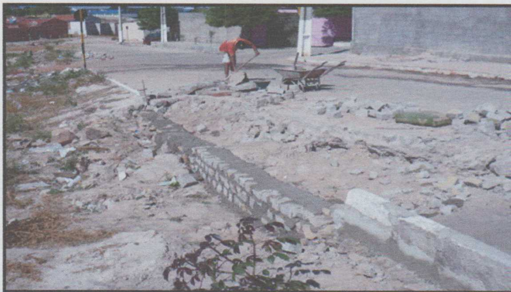
Figura 5 – Início dos serviços de manutenção no calçamento da Av. Antônio C. Sobrinho