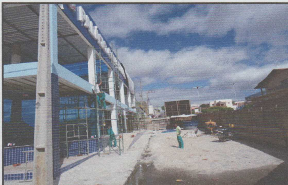
Figura 15 – Fiscalização do Palácio Gov. Eduardo Campos