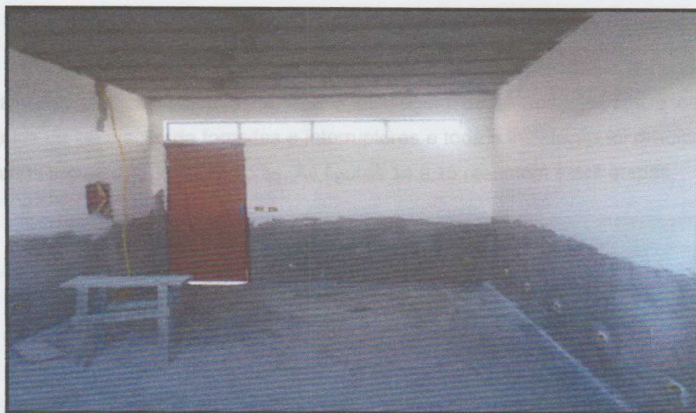
Figura 12 – Reforma na sala de aula da Escola Municipal Maria Santa de Oliveira Mendes

Para as salas de aulas foram recebidas novos painéis e tubos de energia, as paredes foram lixadas, rebocadas e pintadas como mostra na imagem 12 e 13, recebendo um lugar confortável para os alunos desfrutarem melhor dos estudos.