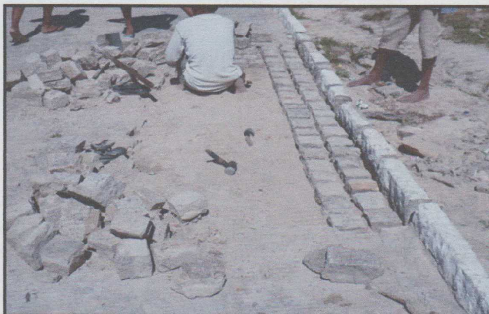
Figura 6 – Início da reposição da linha d'água do calçamento da Av. Antônio C. Sobrinho