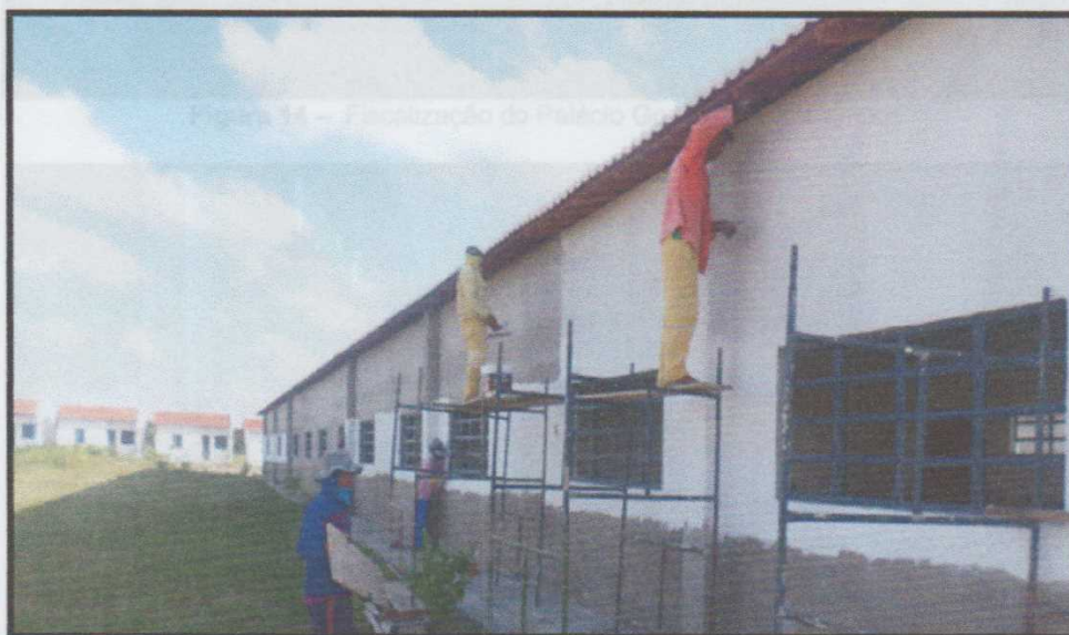
Figura 13 – Reforma na Escola Municipal Maria Santa de Oliveira Mendes

Para as salas de aulas foram recebidas novos painéis e tubos de energia, as paredes foram lixadas, rebocadas e pintadas como mostra na imagem 12 e 13, recebendo um lugar confortável para os alunos desfrutarem melhor dos estudos.