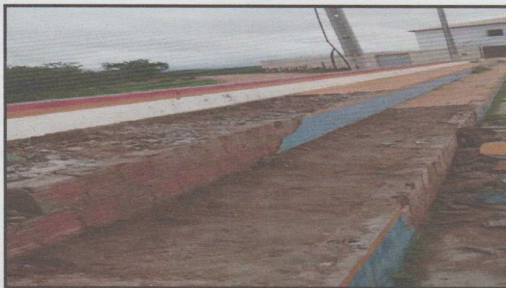
Figura 1 – Detalhe do estado arquibancada

Como mostra nas figuras 01 e 02 expõe a situação antes da reforma, da arquibancada e do piso da quadra poliesportiva, a 03 e 04 apresentam a conclusão do revestimento da parede de suporte do alambrado e da conclusão da reforma do piso da quadra.