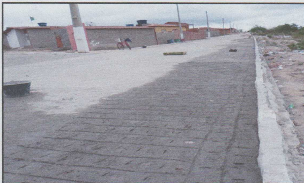
Figura 8 – Finalização do serviço do calçamento da Av. Antônio C. Sobrinho