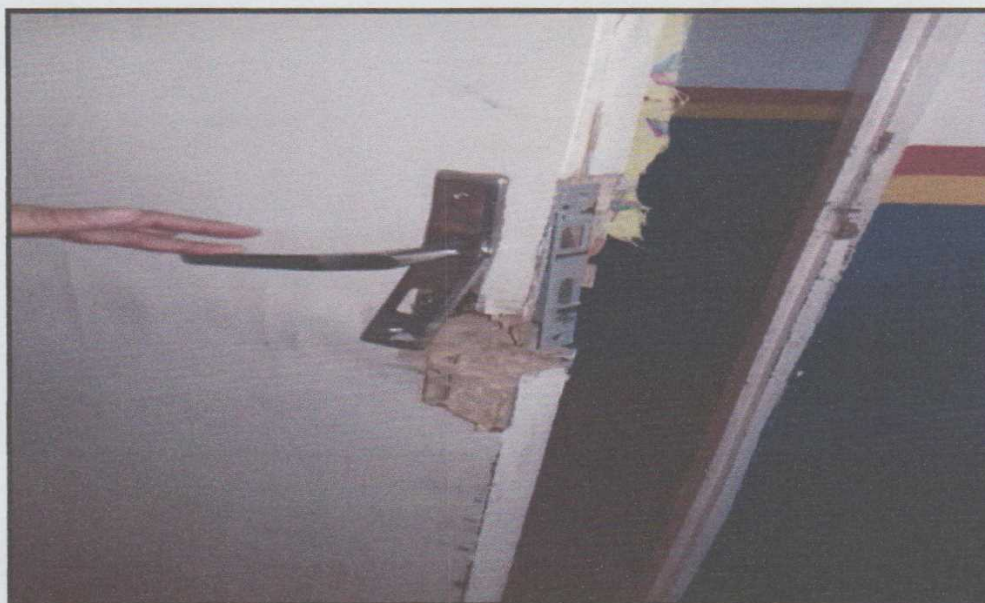
Figura 11 - Porta danificada na Escola Municipal Maria Santa de Oliveira Mendes

A escola Maria Santa de Oliveira Mendes passou por uma reforma pois já estava precisando, na qual a porta da figura 11 abaixo, estava muito danificada, então ela foi retirada e posta outra.