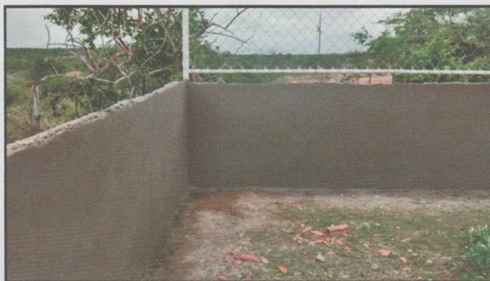
Figura 3 – Registro do revestimento pronto da parede do alambrado