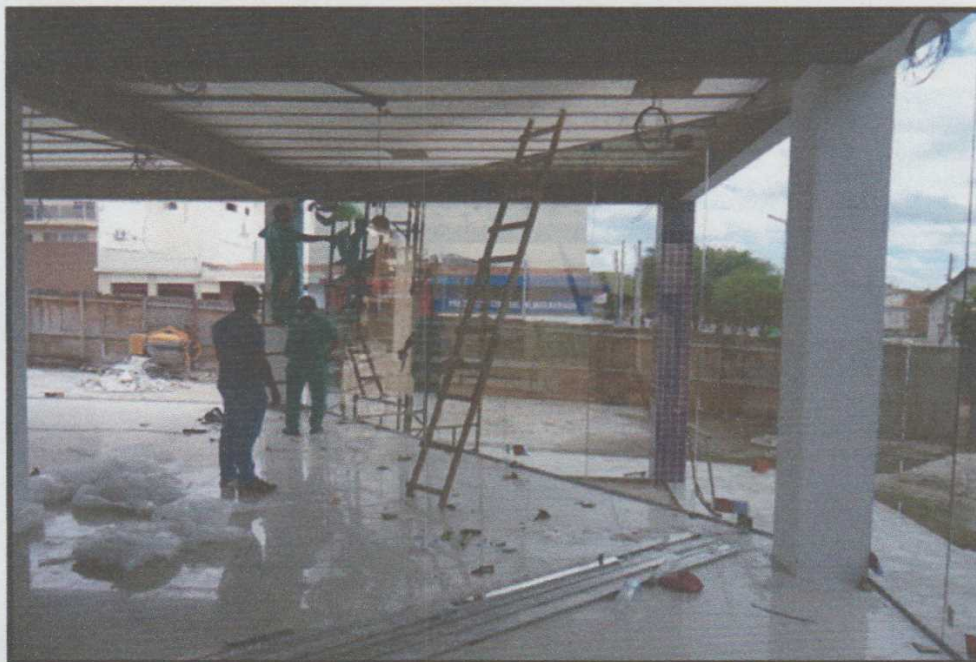
Figura 14 – Fiscalização do Palácio Gov. Eduardo Campos

Na Construção da Prefeitura Municipal de Serrita, foi realizada a parte das instalações elétricas em que foi feita a passagem de eletrodutos, fios e cabos, seguida da instalação de tomadas e interruptores e toda a instalação foi dividida em circuitos protegidos por disjuntores. As figuras 14 e 15 resumem estas etapas.