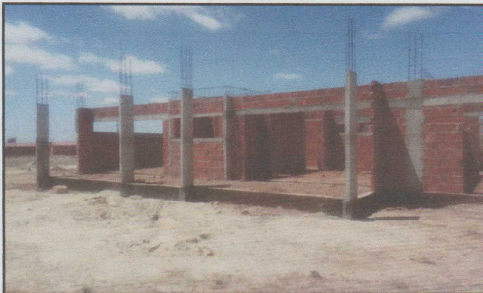
Figura 10 – Fiscalização na Creche Nossa Sra. Da Conceição