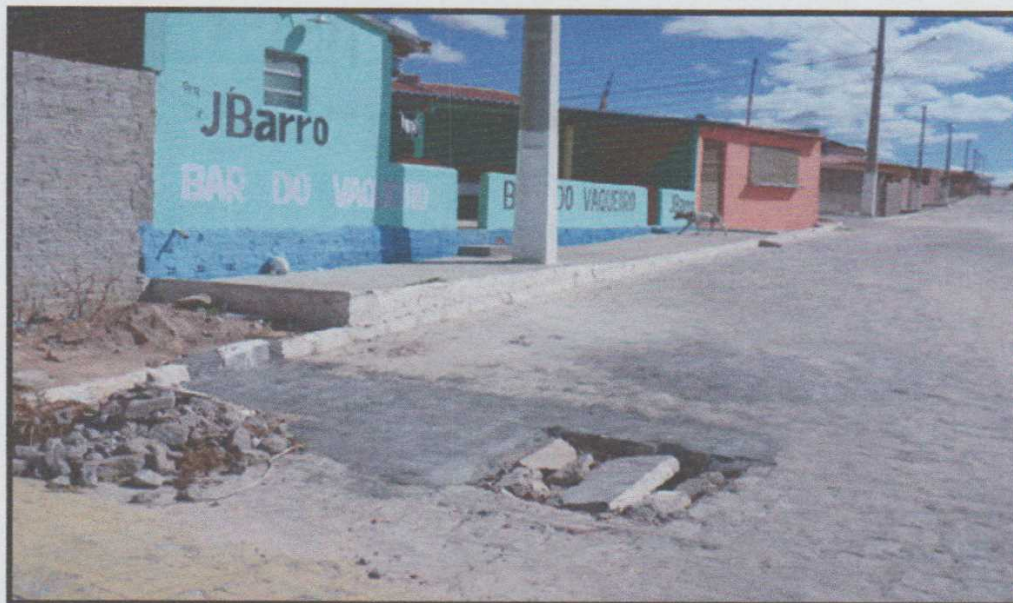
Figura 7 – Reajustes e finalização no calçamento da Av. Antônio C. Sobrinho