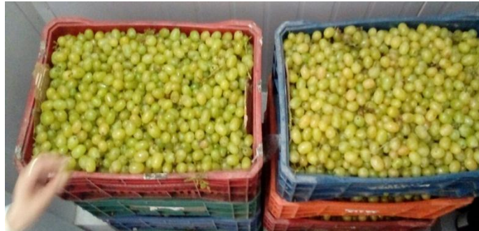
Figura 3- Uvas da Cultivar Cotton Candy.

A variedade utilizada para o experimento foi a cv. Cotton Candy (Figura 3) doada pela Cooperativa Agrícola Nova Aliança (COANA). Foi recebida em caixas de plástico de 20 kg de capacidade, onde realizou-se a pesagem, obtendo 206 kg de uvas. A uva apresentou teor de sólidos solúveis médio de 18 °Brix, pH médio de 4,24, açúcar residual de 186,76 g.L -1 e acidez titulável média de 4,5 g.L -1 em ácido tartárico.